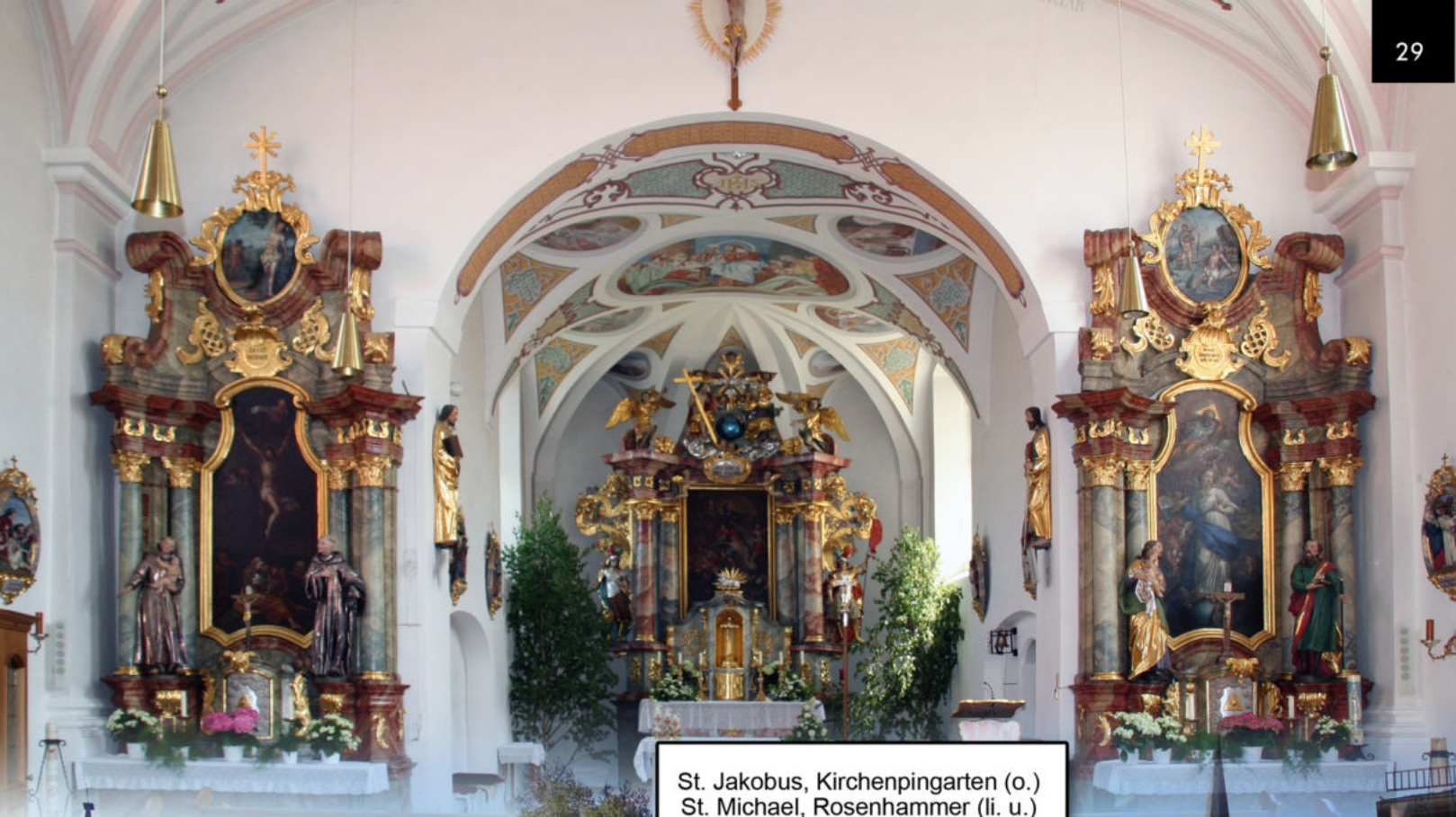
St. Jakobus, Kirchenpingarten (o.) St. Michael, Rosenhammer (li. u.) Friedhofskapelle St. Stephan, Weidenberg (mi. u.) Bartholomäuskirche, Emtmannsberg (re. u.)