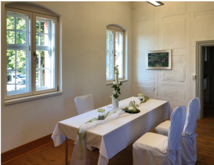
Trauzimmer im Schloss Emtmannsberg

Emtmannsberg und seine Ortsteile sind durch die verkehrsgünstige Lage - Bundesstraße 22 und BAB A9 (Nürnberg - Berlin) - bestens zu erreichen.