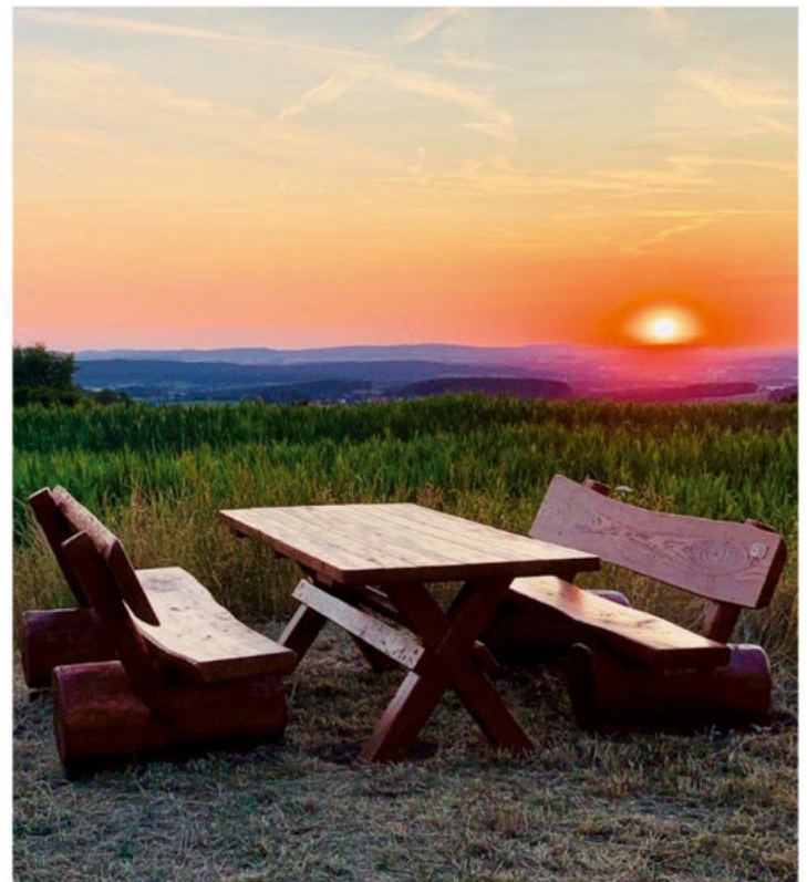
Sonnenuntergang am Hochbehälter Emtmannsberg

Die Bildungseinrichtungen, Kirchen/Pfarrämter, Vereine Veranstaltungstermine der Gemeinde Emtmannsberg finden Sie unter www.emtmannsberg.de .