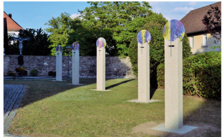
Gebetsweg neben der Kirche in Kirchenpingarten

Der Gebetsweg wurde nach Motiven des Glorreichen Rosenkranzes vom Kirchenkünstler Erwin Otte aus Reuth bei Erbendorf gestaltet. Er lädt ein zum stillen Gebet, zur inneren Einkehr und zum Verweilen. Die Glasbilder auf fünf Stelen beginnen - gegen das Sonnenlicht betrachtet - zu leuchten und es entstehen Bilder, die vorher nicht zu sehen sind.