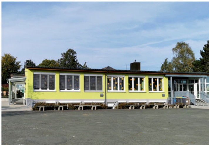
Kindertageseinrichtung und Grundschule